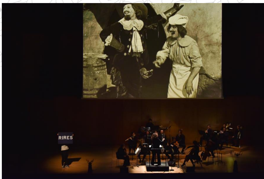
Ciné-concert L'Étroit Mousquetaire à la Philharmonie de Paris.