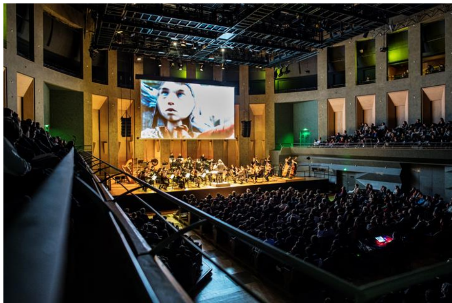
Ciné-concert Pierre et le Loup à la Philharmonie de Paris.