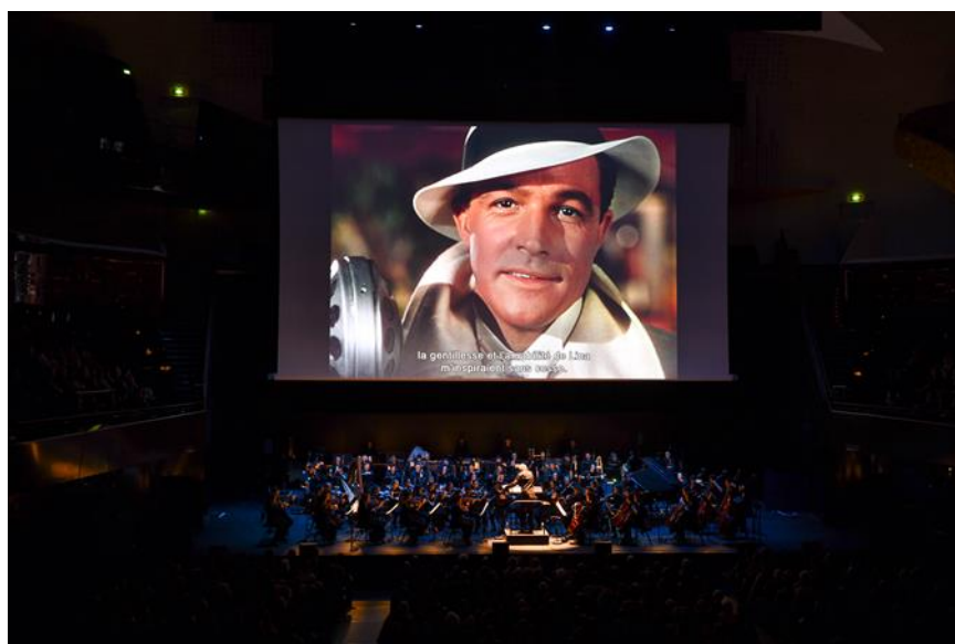
Ciné-concert Singin' in the Rain à la Philharmonie de Paris.

Projeter les images suivantes en guise d'exemples :